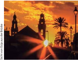
Sicht von Écija aus der Brücke

Diese Kirche beherbergt interessante Kunstwerke aus dem Barock. Die Kirche erhält auch im Hauptaltarbild einen Sarkophag aus dem 5. Jahrhundert mit Bibelszenen. Der in einem Renaissance-Stil errichtete Turm ist mit einer Innenhof verbunden, wo man einen Bogen finden kann, der zu der alten Kirche gehört.