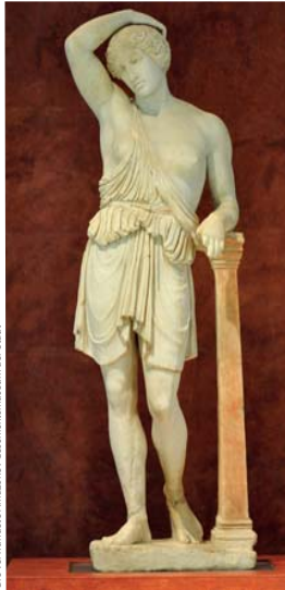
Die Verwundete Amazone, Geschichtsmuseum der Stadt

Dieser Palast ist ein der höchsten Ikonen der barocken Architektur in Andalusien. Innerhalb des Palastes können wir das Geschichtsmuseum der Stadt besichtigen, das außergewöhnliche römische Stücke wie „La Amazona Herida“ („Die verwundete Amazone“) und auch eine große Mosaiksammlung beherbergt.